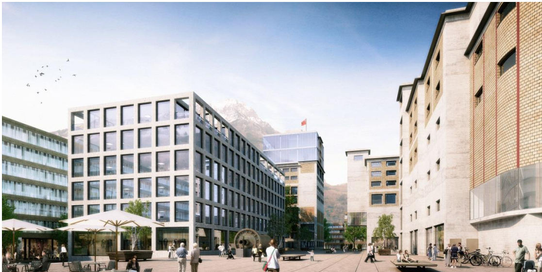
Die erste Bauetappe – das Herzstück von Nova Brunnen – wird ab 2016 bezugsbereit sein.