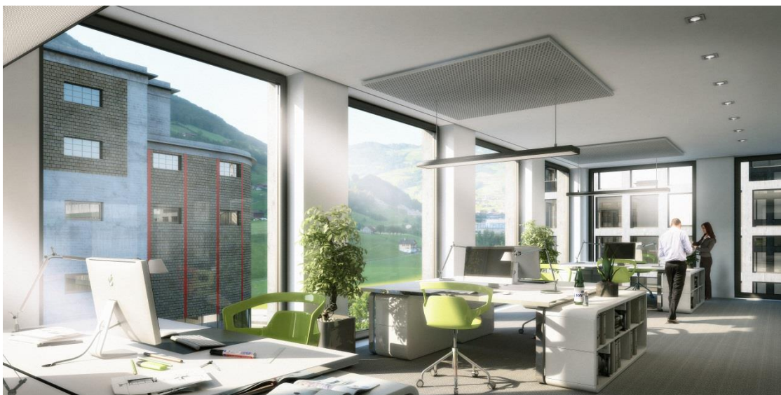
Der Nova Brunnen Business-Lifestyle der Zukunft: modernste Infrastruktur in urtümlicher Umgebung mit bester Verkehrsanbindung.